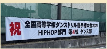
← STEP様が横断幕を作ってくださいました！ 道路側にあるので、とっても目立ちます

↑ なんのワンダ大使がご来校された際、ダンスを披露させて頂きました。生徒はこの笑顔。