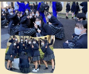
↑ 終業後のお掃除もお手の物 カメラを向けるとすぐにピース