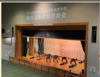
↑ 都立の総合学科高校の教育活動成果発表会で、パフォーマンスを立派でした。