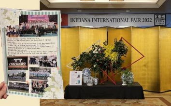
↑ 各国の大使夫人が集まるイベントに本校も出展することに。早速英語版SSD通信を発行し、配りました。

↑ なんのワンダ大使がご来校された際、ダンスを披露させて頂きました。生徒はこの笑顔。